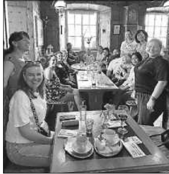
Das Welcome Center lädt in entspannter Atmosphäre zum Deutsch üben und zum Kennenlernen neuer Leute ein.

Das Welcome Center ist eine Einrichtung der Wirtschaftsförderung Schwarzwald-Baar-Heuberg und der IHK Schwarzwald-Baar-Heuberg. Das Ministerium für Wirtschaft, Arbeit und Tourismus Baden-Württemberg sowie die Förderer des Welcome Centers unterstützen das Center.