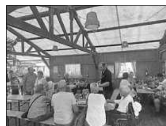
Mittagszeit am Sonntag

Unsere Besucher konnten bei bestem Wetter neben heißen Seelen und am Sonntag Schweinebraten mit Kartoffelsalat, Bier und nicht alkoholischen Getränken, einen Aperol oder eine selektierte Weinauswahl genießen, während sie unserer Live-Musik gelauscht haben.