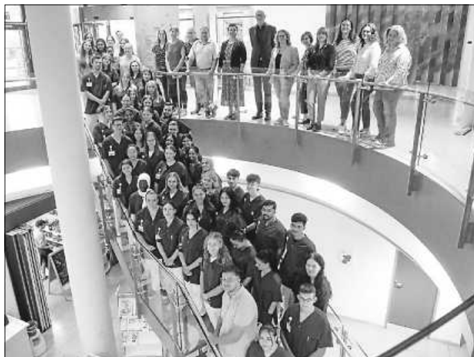
58 Auszubildende haben diesen Herbst ihre Ausbildung am Klinikum Landkreis Tuttlingen begonnen. Das Team des Ausbildungszentrums und die Geschäftsführung des Klinikums sind auch auf dem Foto mit dabei.

Das Klinikum Landkreis Tuttlingen wünscht einen guten Start auf ihrem vielversprechenden beruflichen Weg!