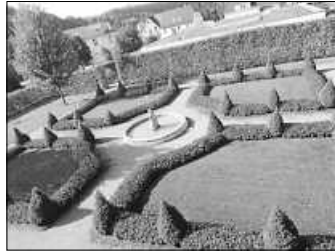
Schlossgarten