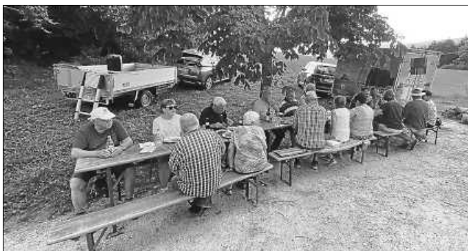
Ein schattiges Plätzchen