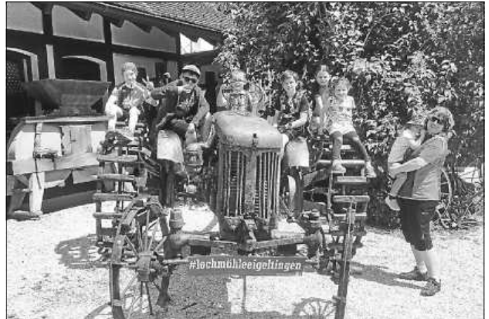
Wir sind stolz auf unseren Nachwuchs!