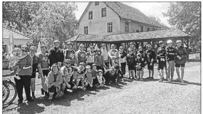
Tolle Gruppe bei der Radausfahrt