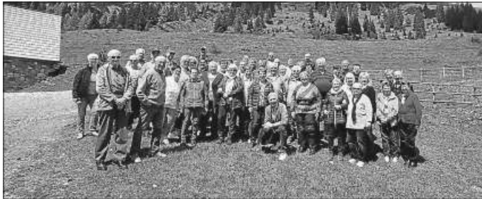
Gruppenbild VdK OV Immendingen

Zu einer 5-tägigen Reise ins Salzburger Land machte sich der VdK-Ortsverband Immendingen vom 08.05.-12.05.2024 auf den Weg. Am frühen Morgen ging die Fahrt entlang des Bodensees nach Landsberg am Lech. Dort angekommen im Landsberger Hof, gab es ein reichhaltiges Frühstück. Gestärkt ging es weiter, vorbei an München, Salzburg nach Filzmoos, ins schöne 4**** Hotel Hanneshof. Angekommen so gegen 18.00 Uhr, empfing uns der Chef des Hauses, Herr Mayr. Nach dem Einchecken und Zimmerbezug gab es ein reichhaltiges Abendessen. Am nächsten Morgen ging es gemütlich mit einer Führung durch den Ort Filzmoos. Anschließend unternahmen wir eine Rundfahrt bis nach Zell am See. Nach einem kurzen Spaziergang am See ging es weiter Richtung Maria Alm. Eine traumhafte Lage, umgeben vom Hochkönigsmassiv. Mit einem Abstecher nach Bischofshofen, wo wir die Skisprungschanze der Vierschanzentournee bestaunen konnten.