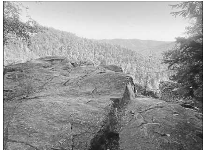
Sicht von Zweribach-Wasserfall

Wir freuen uns auf einen erlebnisreichen Tag mit Euch.