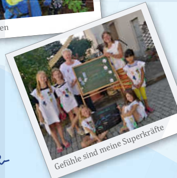
Gefühle sind meine Superkräfte

Schnell mit diesem QR- Code anmelden (möglich ab 03.06.2024)