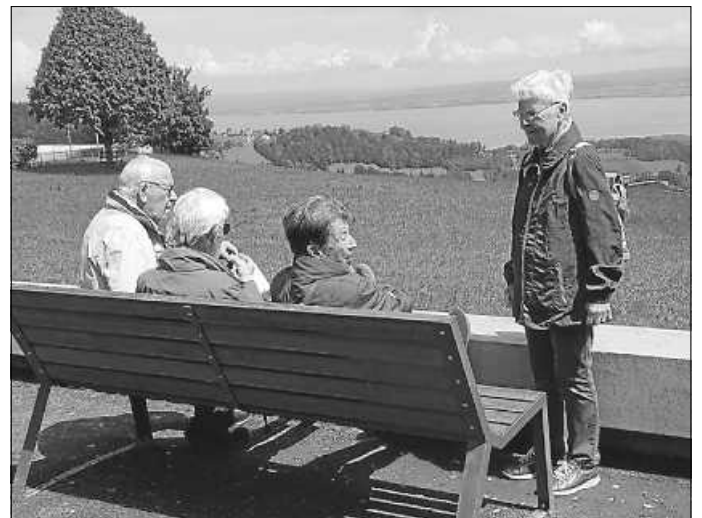
Weiter Blick von Heiden über den Bodensee.

Dort am Seeufer feierten viele das schöne Samstagabendwetter und auch wir freuten uns über den gelungenen regenfreien Ausflug. WWH