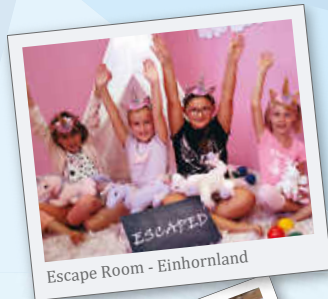
Escape Room - Einhornland

Nur durch Ihre Mithilfe gibt es dieses Jahr wie- der ein tolles Programm.