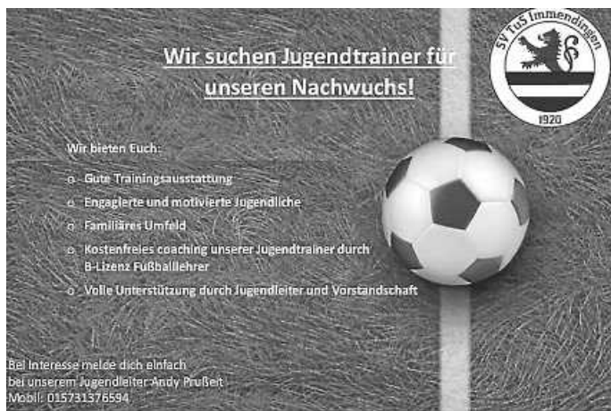
Plakat: SV TuS Immendingen