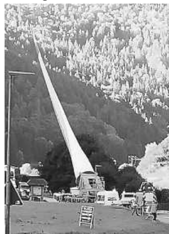
Ein Energiewindrad-Flügel unterwegs auf der Landstraße

Nach der schönen Fahrt an den Bodensee und ins Appenzeller-Land sowie in den Bayerischen Wald hatte die Immendinger Schwarzwaldvereinsfamilie erneut Glück und wunderschönes Wetter bei dem Ausflug mit Familie Hiestand am letzten Freitag. Das Feldberggebiet war mit dem Bus schnell erreicht. Im Wiesental gab es dann den seltenen Senkrechttransport eines Energiewindrad-Flügels zu bestaunen.