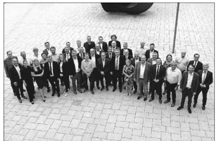
Neuer Kreistag: Der neue Kreistag trat in der konstituierenden Sitzung am 5. September 2024 zusammen