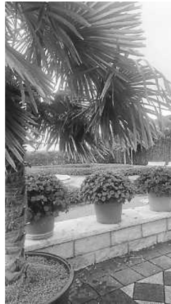
Schlosshof unter Palmen

Am bundesweiten Tag des offenen Denkmals beteiligte sich der Verein INKGE e. V. und öffnete das Schlosstor von 14 Uhr bis 18 Uhr. Bereits um 13 Uhr kamen die ersten Gäste, gegen 16 Uhr waren acht Kuchen verkauft und alle Stühle belegt. Viele Gäste aus nah und fern besuchten erstmals das Untere Schloss und waren begeistert von der schönen Gartenanlage, einige jedoch enttäuscht, da sie gerne das ganze Schloss und nicht nur das Erdgeschoss besichtigt hätten. Eine Wandergruppe des Schwarzwaldvereins Immendingen konnte sich nach einem zünftigen Fußmarsch noch am Kuchenbuffet stärken. Eine Präsentation mit 50 Fotos aus den letzten 15 Jahren des Unteren Schlosses und seiner Umgebung fand großen Anklang. Ein herzliches Dankeschön gilt allen Bäckerinnen und helfenden Händen, die zum guten Gelingen beigetragen haben.