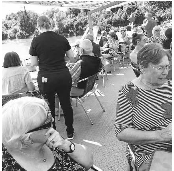
Gemütliche Schifffahrt auf dem Hochrhein

Nach Todtnau, Schönau und Todtmoos erreichte die fröhliche Gruppe durch malerische Schwarzwaldtäler bald St. Blasien. Der Besuch des imposanten Domes mit Deutschlands größtem Kuppelbau beeindruckte die Besucher. Über den hoch gelegenen Kurort Höchenschwand ging die Fahrt weiter ins Rheintal nach Waldshut. Dort blieb nach dem vorzüglichen Mittagessen noch genügend Zeit für einen Stadtbummel oder ein kühlendes Eis.