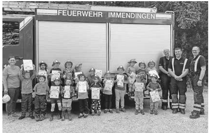
Besuch der Freiwilligen Feuerwehr Immendingen

Am nächsten Morgen brachten uns die Eltern das Frühstück und wir saßen noch gemütlich zusammen und genossen die Zeit.