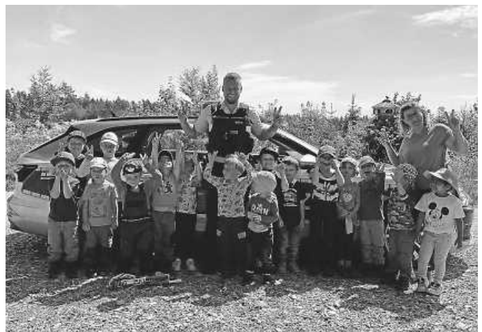
Besuch der Polizei Tuttlingen