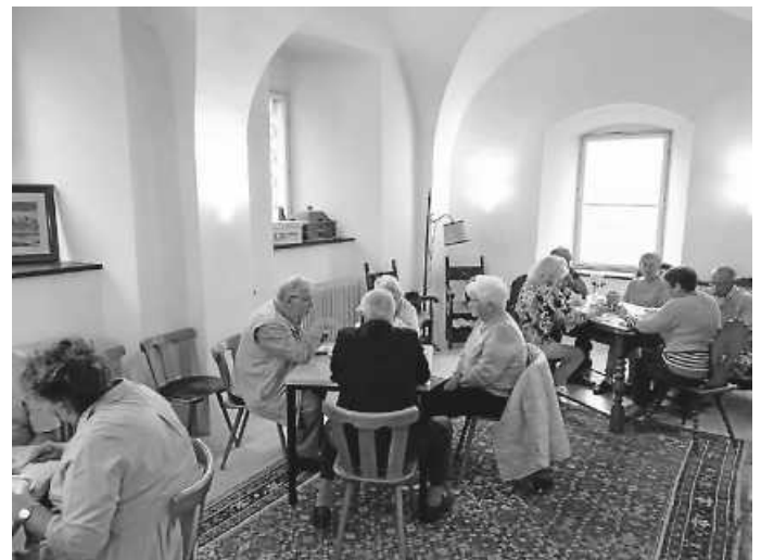
Gäste im Unteren Schloss

Am bundesweiten Tag des offenen Denkmals beteiligte sich der Verein INKGE e. V. und öffnete das Schlosstor von 14 Uhr bis 18 Uhr. Bereits um 13 Uhr kamen die ersten Gäste, gegen 16 Uhr waren acht Kuchen verkauft und alle Stühle belegt. Viele Gäste aus nah und fern besuchten erstmals das Untere Schloss und waren begeistert von der schönen Gartenanlage, einige jedoch enttäuscht, da sie gerne das ganze Schloss und nicht nur das Erdgeschoss besichtigt hätten. Eine Wandergruppe des Schwarzwaldvereins Immendingen konnte sich nach einem zünftigen Fußmarsch noch am Kuchenbuffet stärken. Eine Präsentation mit 50 Fotos aus den letzten 15 Jahren des Unteren Schlosses und seiner Umgebung fand großen Anklang. Ein herzliches Dankeschön gilt allen Bäckerinnen und helfenden Händen, die zum guten Gelingen beigetragen haben.