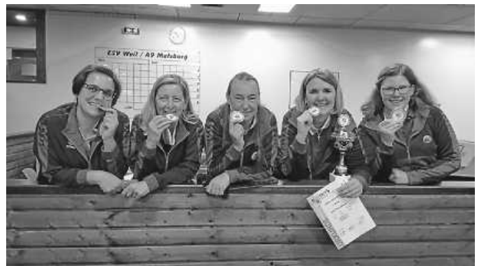
Mannschaft am Finaltag