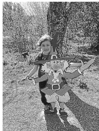
Auf dem Erlebnispfad

Auf den Spuren des Waldwichtelmannes erleben Familien mit Kindern, aber auch gerne Erwachsene, die Natur mit allen Sinnen. Ob Baum-Memory, Kneipp-Tretanlage, Barfuß-Parcours, Hindernislauf oder Weidentunnel, es ist für Abwechslung gesorgt. Großartige Ausblicke z.B. auf die Adlerschanze und den Adlerweiher sind gesichert. Vielleicht sehen wir Skispringer beim Mattentraining, an Sehenswertem wird es nicht fehlen. Ein Tierrätsel mit kleiner Challenge und Rast auf einem Abenteuerspielplatz sind inklusive. Dies weckt Lust bei Groß und Klein!