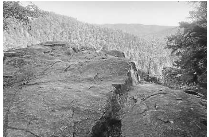
Sicht von Zweribach-Wasserfall

Wir freuen uns auf einen erlebnisreichen Tag mit Euch.