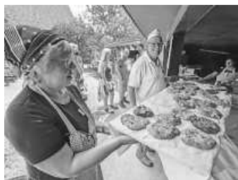
Ofenfrische Dünnele gibt es am Bier- und Backtag natürlich wieder reichlich.

Das Museum hat von 9 bis 18 Uhr geöffnet. Kinder bis 10 Jahre haben freien Eintritt. Eine Saisonkarte für Erwachsene kostet 25 Euro und bietet die ganze Saison freien Eintritt an jedem Öffnungstag und somit auch an jeder Veranstaltung.