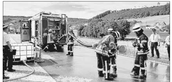
Die Feuerwehren stellen bei der Abnahme der Leistungsabzeichen ihr Können unter Beweis.

Die erfolgreichen Gruppen der Leistungswettkämpfe sind: