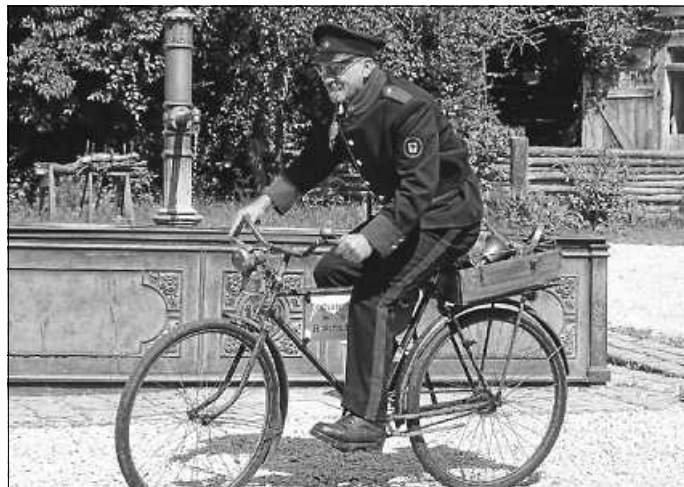
Sein Wort hatte Gewicht: der Dorfpolizist regelte einst den bäuerlichen Alltag und wusste über alles genau Bescheid. Am Donnerstag, 25. Juli, ab 15 Uhr lässt er sich im Rahmen Freilichtmuseum Neuhausen o. E.

Das Museum hat von Dienstag bis Sonntag jeweils von 9 bis 18 Uhr geöffnet. Kinder bis 10 Jahre haben freien Eintritt. Eine Saisonkarte für Erwachsene kostet 25 Euro und bietet die ganze Saison freien Eintritt an jedem Öffnungstag und somit auch an jeder Veranstaltung.