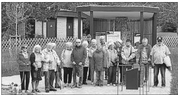
Ein Teil der Dienstagswanderer vor dem Infopoint

Trotz der fortgeschrittenen Jahreszeit besteht weiterhin großes Interesse an der Donauversickerung. Für Ende September sind sogar für zwei Busse mit Interessenten aus der Schweiz und aus Italien Führungen bestellt.