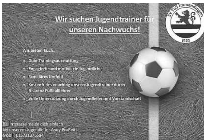
Plakat: SV TuS Immendingen

Wir wünschen allen Mannschaften viel Erfolg.