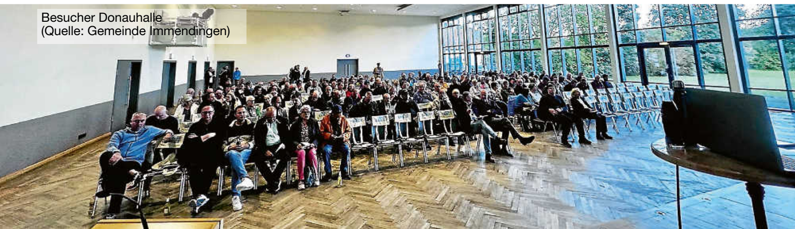
Besucher Donauhalle