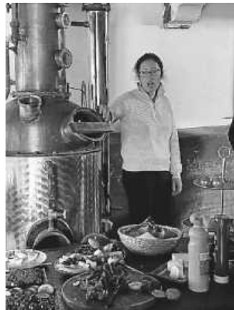
Brennerei auf dem Klosterhof