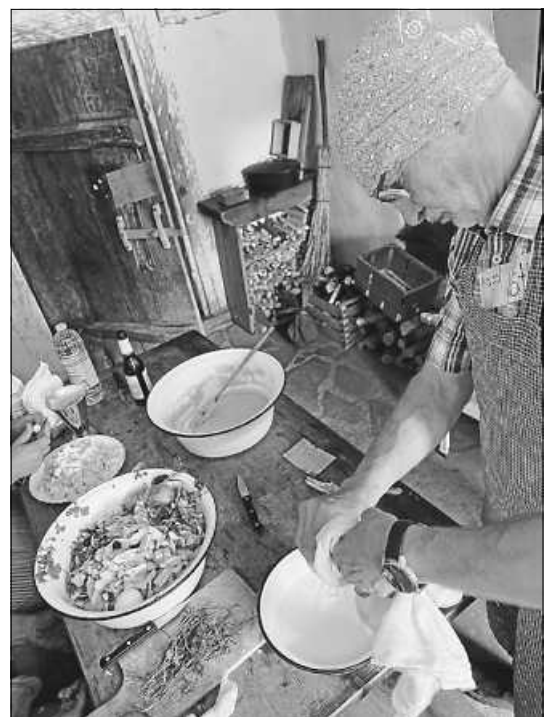
Ein „Bauerntag im Jahr 1899“ heißt das Teambuilding-Projekt für Firmen, Vereine oder Gruppen aller Art im Freilichtmuseum Neuhausen ob Eck.