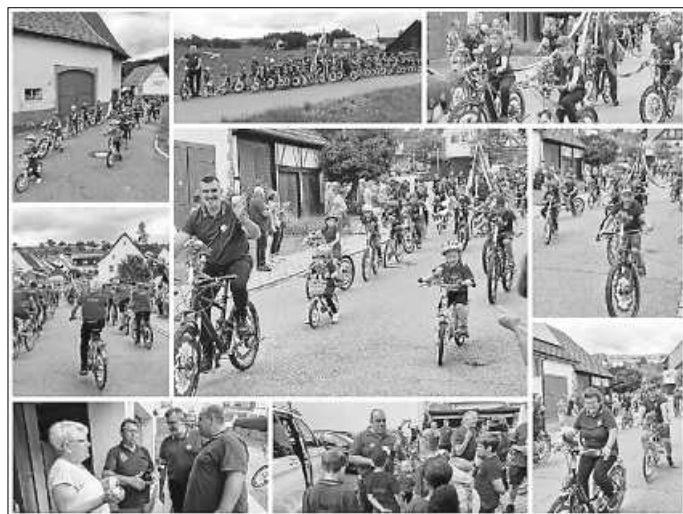
Festumzug: 160 Jahre Musikverein Polyhymnia Leipferdingen - Wir waren dabei!

Am Sonntag trafen wir uns um 10 Uhr bei Michael an der Halle, um von dort gemeinsam nach Leipferdingen zu fahren. Bei Familie Frank angekommen, wurden wir sehr gastfreundlich begrüßt und schmückten bei ihnen unsere Räder fertig. An dieser Stelle möchten wir uns nochmal ganz herzlich bei den beiden bedanken! – Es war sehr schön bei euch! Anschließend gingen wir ins Festzelt und stärkten uns. Bevor wir uns dann zur Umzugsaufstellung trafen. Der Jubiläumsumzug begann um 14:00 Uhr. Neben Musikvereinen und anderen Vereinen, Oldtimer-Gruppen, Traktorfreunden und Radsportvereinen war es ein bunter Umzug. Nachdem wir unsere Räder verräumt hatten, ließen wir den Tag im Festzelt ausklingen. Rundum war es ein tolles Wochenende. Ein großer Dank gilt allen Teilnehmern, besonders auch den Kindern und den Zuschauern. Schön, dass ihr dabei wart!