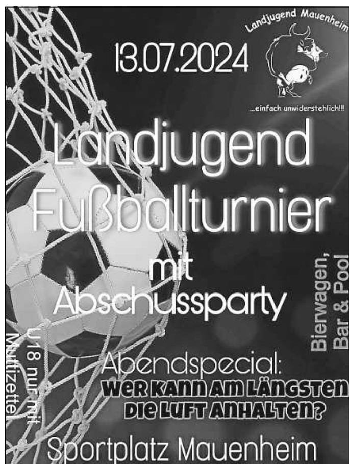
Plakat: Landjugend Mauenheim