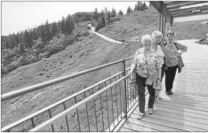
Auf dem Großen Arber