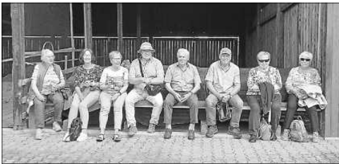
Pause beim Michlbauern

Anderntags folgte die holprige Fahrt auf Waldwegen mit der Tschu-Tschu-Bahn. Inmitten eines großen Naturschutzgebietes erlebten wir das einmalige Naturjuwel des kleinen Arbersees mit seinen schwimmenden Inseln. Nach der Seeumrundung zu Fuß winkte eine herzhafte Brotzeit im Seehäusl. Vor der Rückfahrt beeindruckte uns noch ein echter Einsatz der Bergwacht - glücklicherweise nicht für unsere Gruppe. Nachmittags kam bei Kaffee und Kuchen Eisenbahnostalgie auf im originalgetreu restaurierten Mitropa-Speisewagen in Miltach.