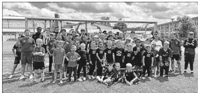
Alle Jugendteilnehmer am Turnier

Wir bedanken uns bei allen Teilnehmern und hoffen auf eine Wiederholung im nächsten Jahr.