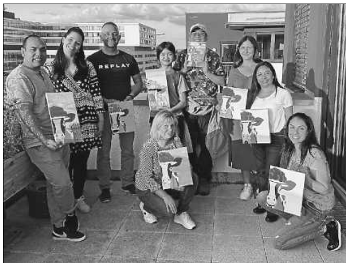
Deutsch lernen und dabei kreativ sein: Das Welcome Center lädt zum Mal-Abend ein.

Die Arbeitsmaterialien werden gestellt, es wird empfohlen, ein altes T-Shirt oder einen Malerkittel mitzubringen, damit die Kleidung nicht schmutzig wird. Um Anmeldung beim Welcome Center Schwarzwald-Baar-Heuberg, auf https://welcome-sbh.de/seminare/ wird gebeten, da die Plätze begrenzt sind.