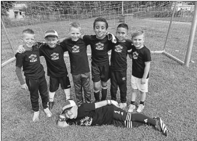
Die Siegermannschaft

Die Vorstandschaft Weitere Fußballinformationen unter: www.svimmendingen.de