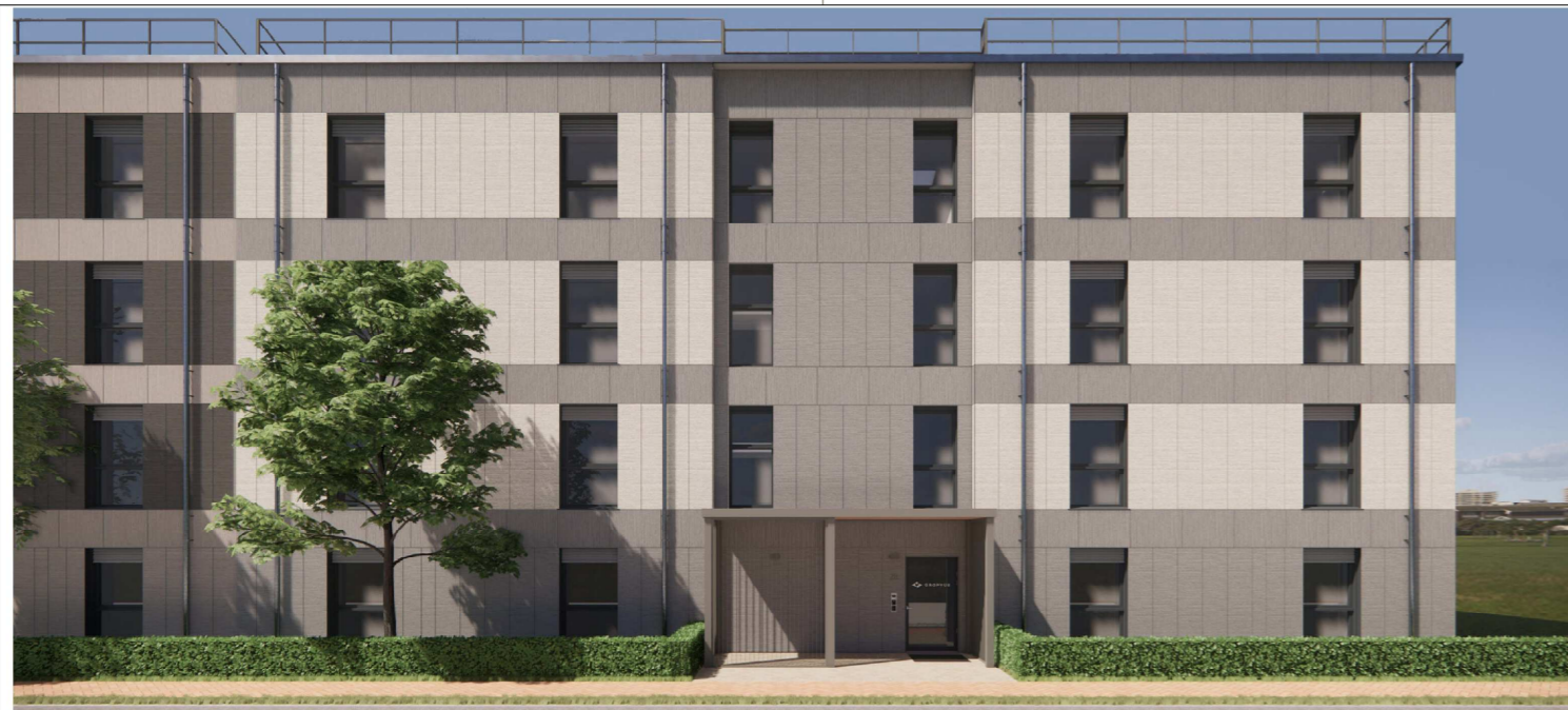
Cluster G | Nord Ansicht

Telefon 030 700 10 12 00 immendingen@gropus.de